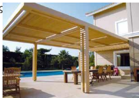
Ανοχή στη διάβρωση κατηγορία II (A2) RICON®: Ανοξείδωτο ασάλι κατάλληλο για πέργκολα, μπαλκόνια